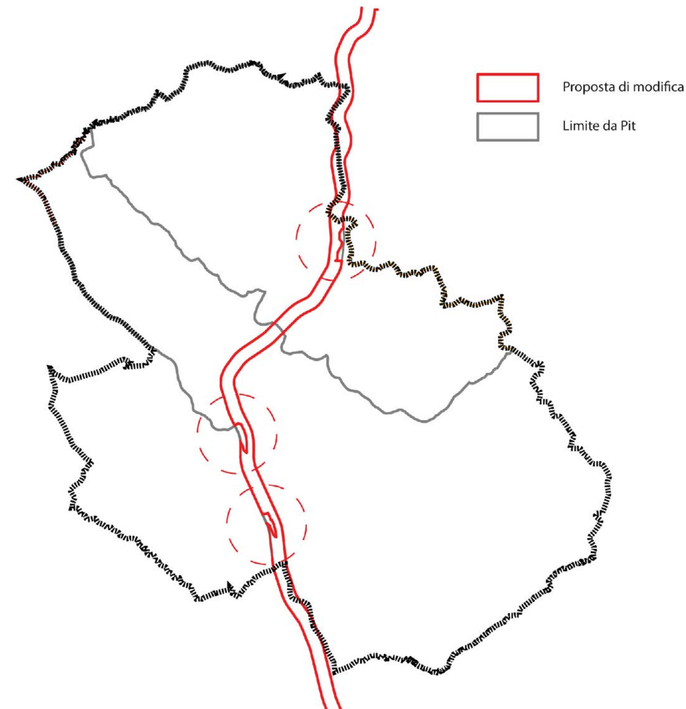
Schema di sovrapposizione delle aree di notevole interesse pubblico di cui all'art. 136 del Codice come espressi da PIT e della proposta di modifica

▨ Proposta di modifica --- Limite da Pit